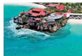
Eden Rock Saint Barths