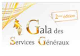
Gala des services généraux